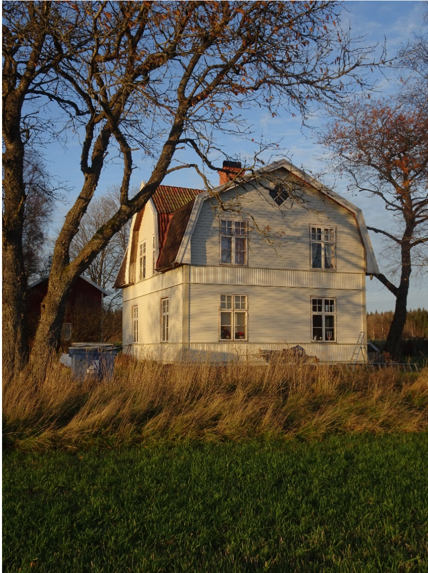
Bringetofta 12:1, Bringhem 1.