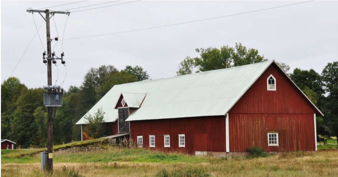
Ladugården på Bringetofta 5:11.