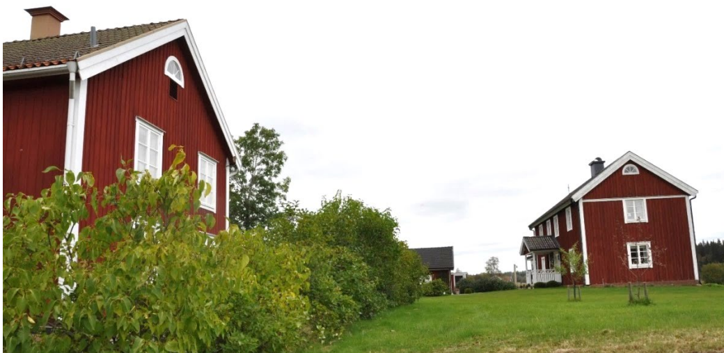
Bringetofta 11:1, församlingshem och Bringetofta 5:14, Flogård 2, parstuga från 1858.