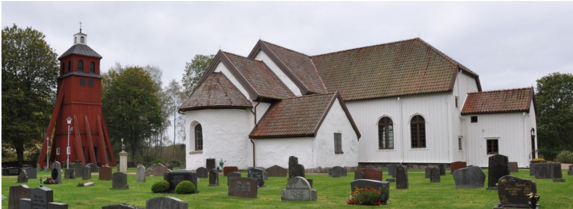
Stenkyrkan av romansk absidtyp, klocktorn till vänster.

fornlämningsdel. Kyrkan från 1100-talets senare del dominerar bebyggelsen i området. Det är en tidig stenkyrka av romansk absidtyp, en vanligt förekommande kyrkotyp i Njudungs folkland. Absid, kor och delar av långhuset är ursprungliga men kyrkan förlängdes åt väster troligen under 1500-talet. De medeltida kalkmålningarna har varit övermålade men togs fram vid en restaurering 1923. Sakristian anses härstamma från 1500-talet, medan absidens målningar av helvetet och yttersta domen tillkom under 1600-talet. Under 1750-talet omgestaltades kyrkan med en långhusutbyggnad i trä mot norr. På kyrkogården finns en rödfärgad klockstapel i trä från 1730. Ett krucifix anses härstamma från medeltiden, medan predikstolen skänktes till kyrkan 1659 av överste Jöran Silvferhjelm från Havsjö.