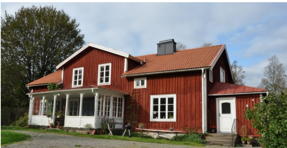
Bringetofta 7:11, Bringetofta prästgård.

1917 uppfördes i byn även en missionskyrka (Bringetofta 5:3), idag förändrad men kvar på sin ursprungliga plats och den används fortfarande aktivt av missionsförsamlingen. Bringetofta prästgård (Bringetofta 7:11) uppfördes 1833 och utgör en viktig del av kyrkbyn. Byggnadens ursprungliga volym, färg och material har bevarats men arkitektoniska detaljer har förändrats. Tidigare var byggnadens veranda av en mindre glasverandamodell, som senare byts ut mot en större öppen veranda. En bred frontespis har öppnats upp genom takfoten. Tidigare låg enkupiga tegelpannor på taket, men idag består takbeklädningen av ett tvåkupigt lertegel. Bottenvåningens tvåluftsfönster med sex rutor har ersatts med treluftsfönster med nio rutor. Gården har ett centralt placerat vårdträd som återplanterats.