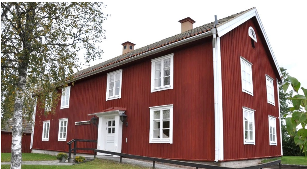
Bringetofta 11:1, nuvarande församlingshem.