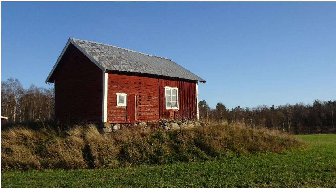
Bringetofta 2:2 Hus 2, enkelstuga.