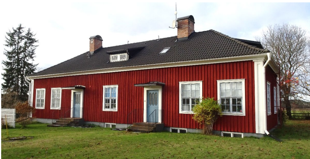
F.d. lärarbostaden på Bringetofta 5:10.