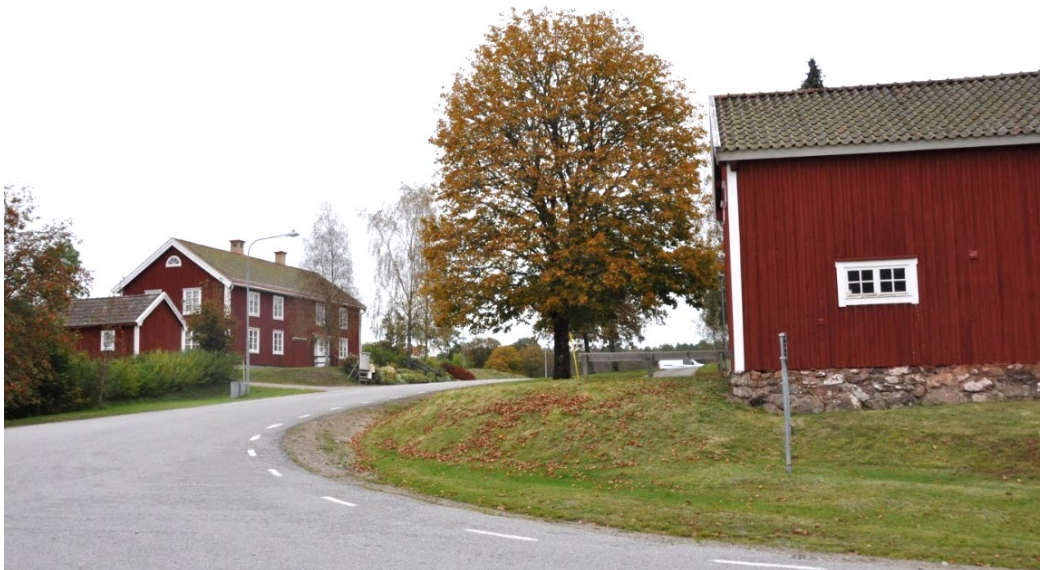
Sockenmagasin, Bringetofta 7:9 th och nuvarande församlingshemmet tv i vägsäl vid Bringetofta kyrka.