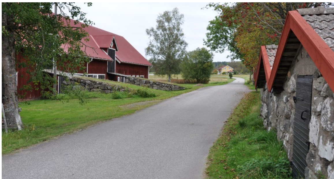
Bringetofta 3:4, Bringetofta Brogården 1.

Intill kyrkan ligger sockenmagasinet, uppfört under 1850-talet på naturstensgrund och de karaktäristiska luckorna och mindre fönstren finns bevarade. Kyrkbyn är relativt enhetlig med locklistpaneler med röd slamfärg, vita dörr- och fönsterfoder samt röda tegeltak. I bystrukturen ingår även ett f d ålderdomshem från omkring 1850, en affär från 1920-talet och två parstugor från omkring 1860. Lantbruken har ladugårdar av stor volym, stensatta körbroar och välbevarade fönster och portar. På Bringetofta 3:4, Brogården, har ladugården två parallella körbroar och tvärs över vägen även en dubbel matkällare, vilka är unika i sitt slag i området. När Brogården passeras utemot Drageryd, upprepas mönstret tydligt av bostadsbebyggelse på den östra sidan av vägen med de tillhörande ladugårdarna på den andra sidan av vägen. Detta ingår inte i riksintresseområdet men är av kulturhistoriskt värde.