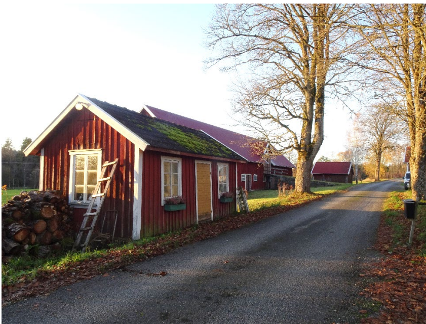
Uthus på Bringetofta 12:1, Bringhem 1.