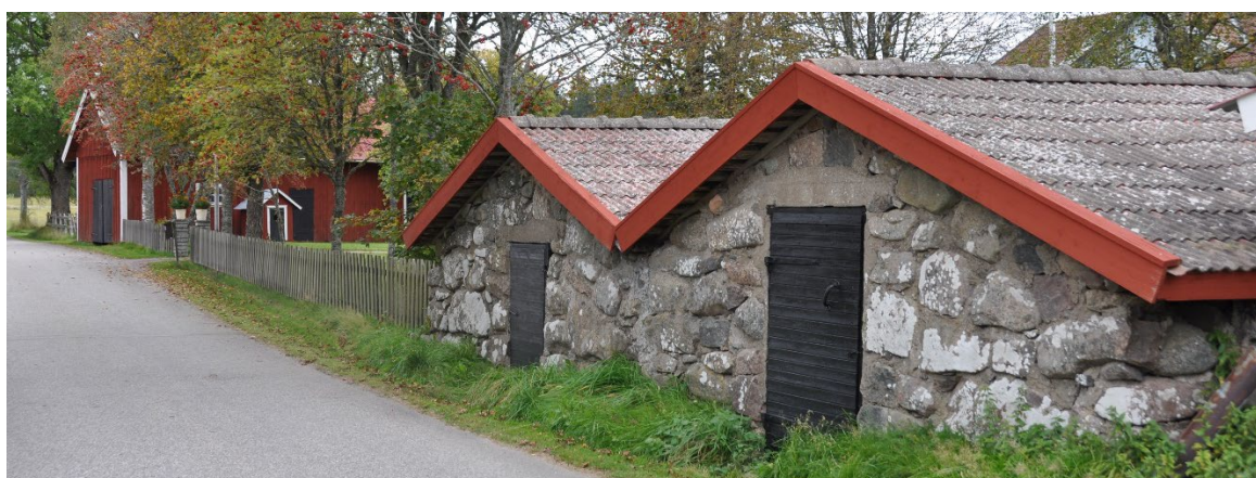
Dubbelkällaren på Bringetofta Brogården 1.

Bringetofta sockencentrum är ett mycket representativt exempel på länets administrativa sockencentra med alla de bebyggelseinslag som en gång fanns i länets kyrkbyar. Den omkringliggande bebyggelsen är välbevarad och har genomgått få förändringar sedan 1800-talets andra hälft, trots att byggnaderna många gånger har bytt användningsområde. Området har lång historisk kontinuitet där människor bott och verkat åtminstone sedan den yngre järnåldern.