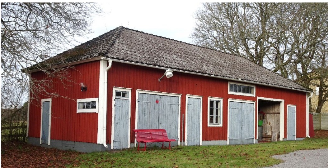
Uthus på Bringetofta 5:10

Bringetofta f.d. skolbyggnad och lärarbostad (Bringetofta 5:10) med kompletterande uthus från 1930, är båda av större volym. Slätputsad grund, faluröd locklistpanel och ljusst blå dörrar med de ursprungliga småspröjsade fönstren är mycket välbevarade. Gavlar och omfattningar är vita och bostadshusets hörn består av kraftigt markerade pilastrar. De valmade taken har beklänts med mörka betongpannor.