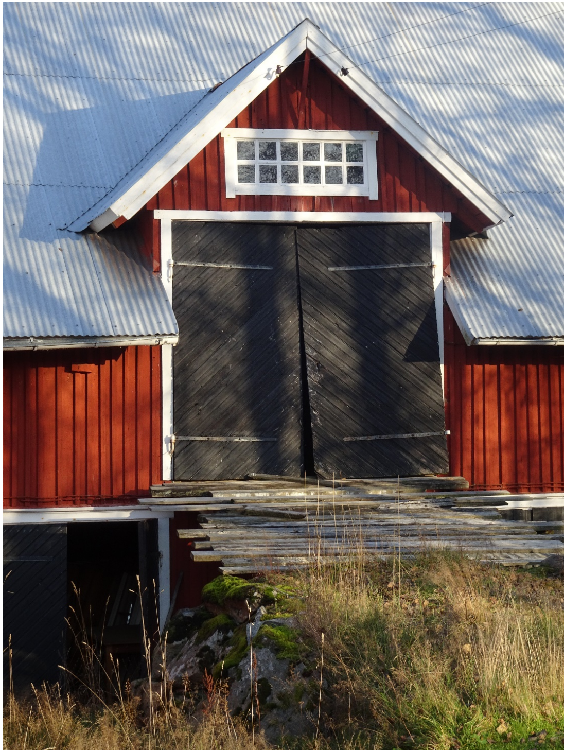
Bringetofta 2:2 Hus 4, ladugård i vinkel.