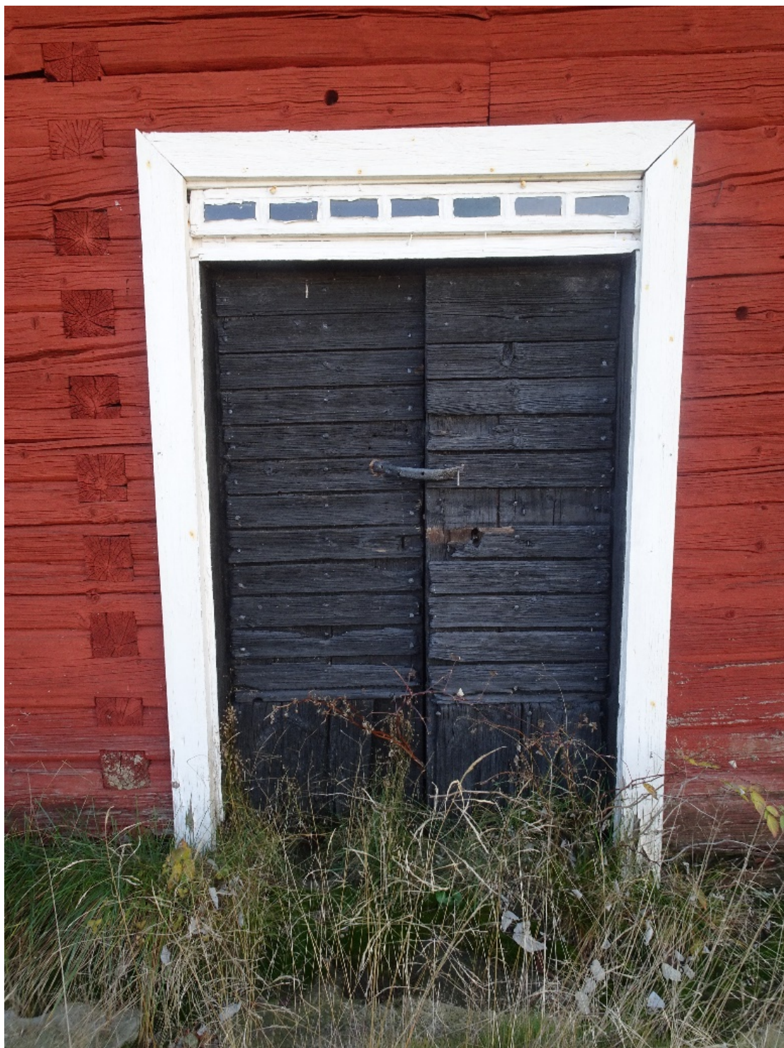
Bringetofta 2:2 Hus 2, enkelstuga.